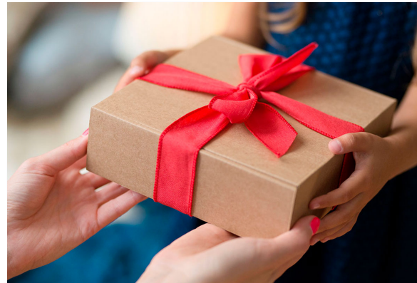
Show room de regalos Responsables