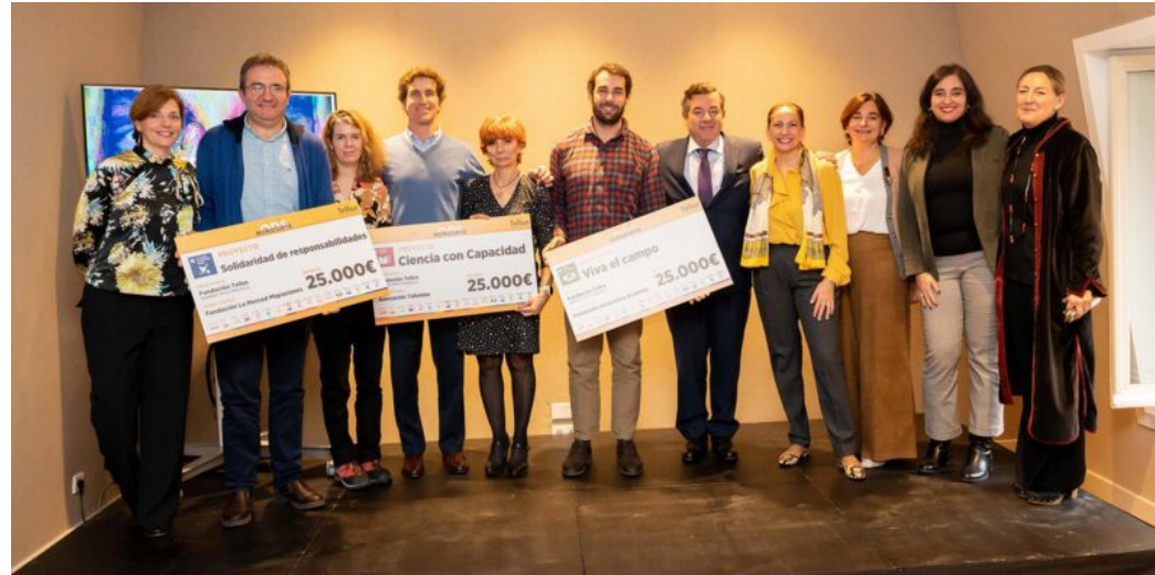
Ganadores convocatoria Horizonte ODS