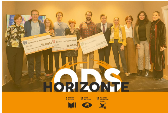
Ganadores convocatoria Horizonte ODS

A la primera edición de ‘Horizonte 2022 se han presentado un total de 115 candidaturas. Los proyectos premiados han sido elegidos por jurado externo compuesto por seis expertos y 16 empleados voluntarios de la oficina española del despacho Herbert Smith Freehills, en el marco de la convocatoria que la Fundación realizó el pasado mes de septiembre.