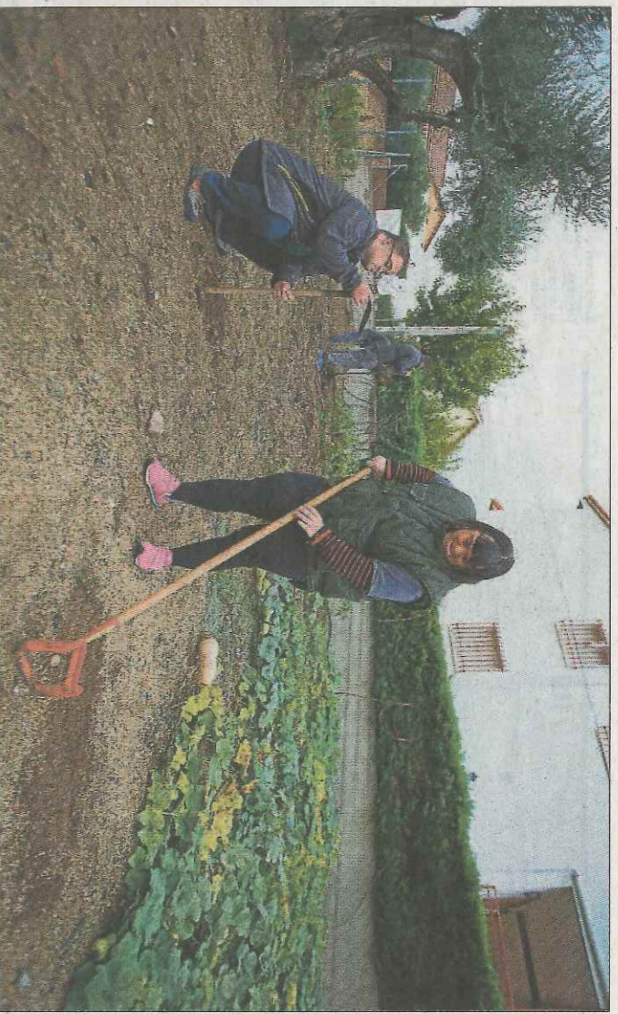
Jóvenes con discapacidad trabajan en el vivero de la Asociación Talismán en San Martín de Valdeiglesias.