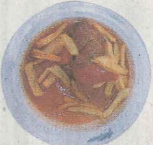
Morcillo estofado con patatas