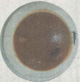
Lentejas con chorizo

ASTURIANOS. Vallehermoso, 94. Metro: Canal. Tlf: 91 533 59 47. De lunes a domingo de 12,00 a 17,00 y de 20,00 a 00,00. Tierra sábados. Precio menú: 12€